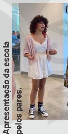
Apresentação da escola pelos pares.

Esta escola do ensino secundário é uma referência nos Estados Unidos e só em 2025 abrirá oficialmente a porta a estrangeiros. Nova parceria YMCA.