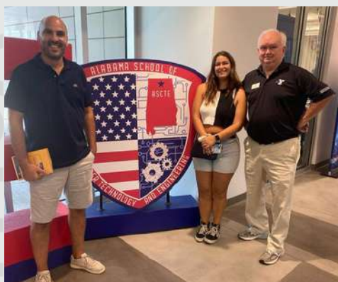
Visita da YMCA em 2023.